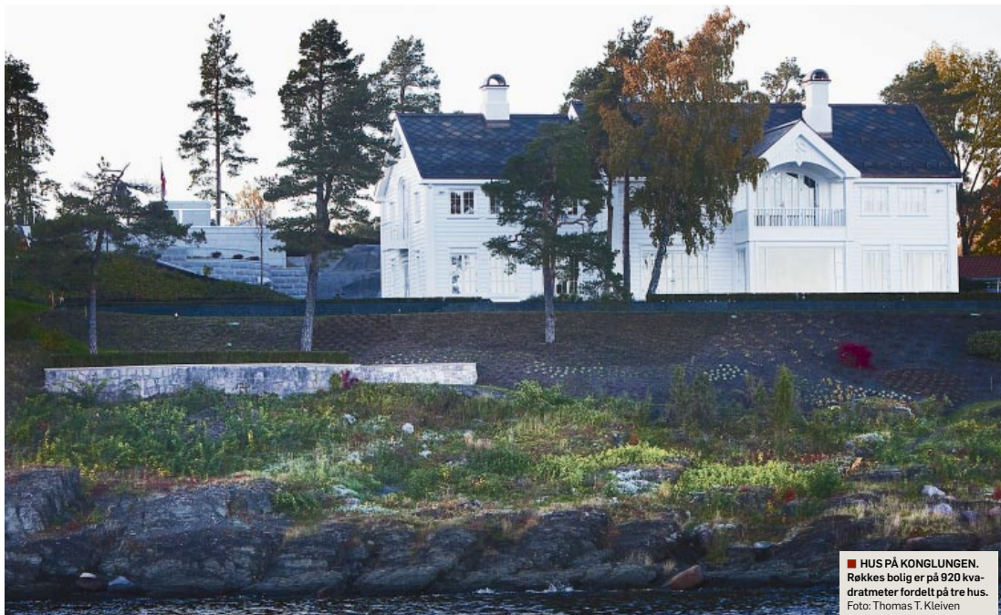
HUS PÅ KONGLUNGEN. Røkkes bolig er på 920 kvadratmeter fordelt på tre hus.